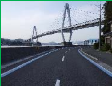
③ 生名島、佐島、弓削島 3島めぐりコース