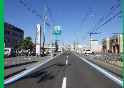
② 今治・西条ゆうゆう輪道