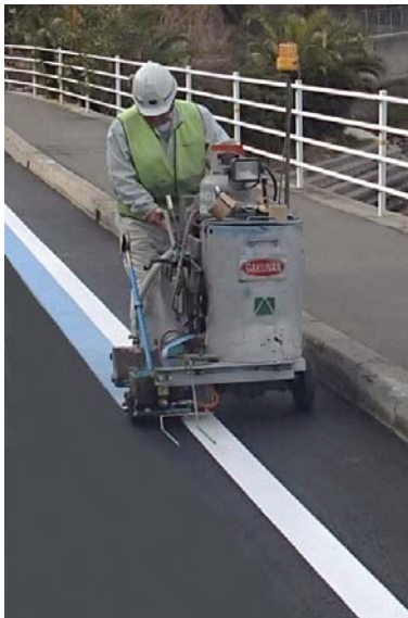
汎用区画線施工機で施工できます。