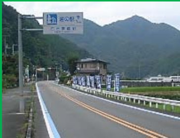
① 宇和島・四万十だんだん街道